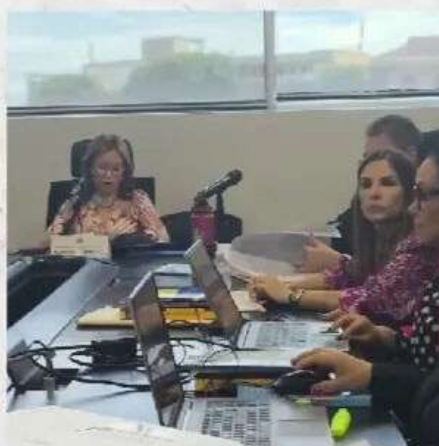
Comisión de la Mujer, la Niñez, la Juventud y la Familia, Reunión de Subcomisión del Proyecto de Ley 141