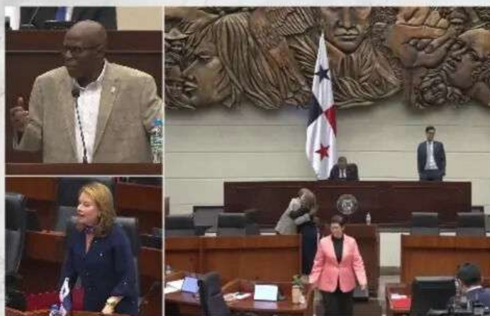
Aprobación en segundo debate