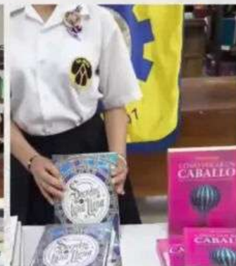
Colegio Artes y Oficios