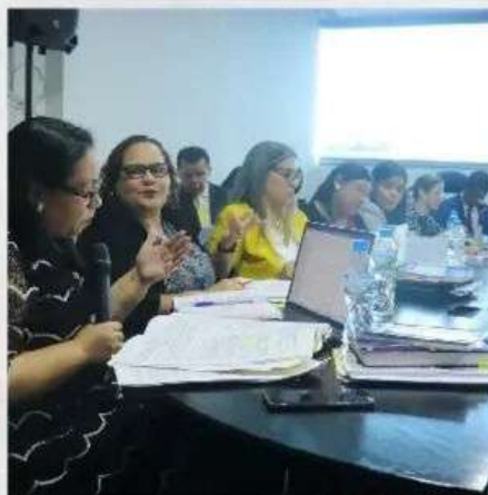
Subcomisión del Proyecto de Ley 140