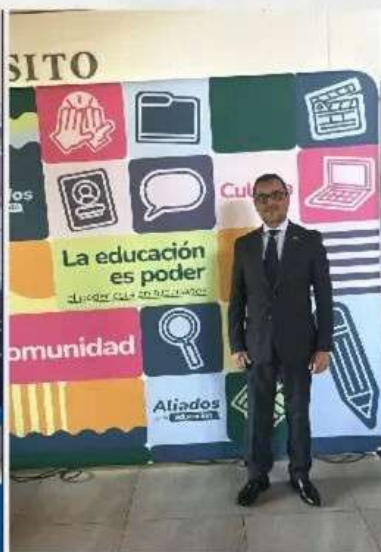
Acto inaugural de la Feria Universitaria