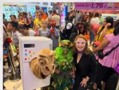
Celebración del día del niño