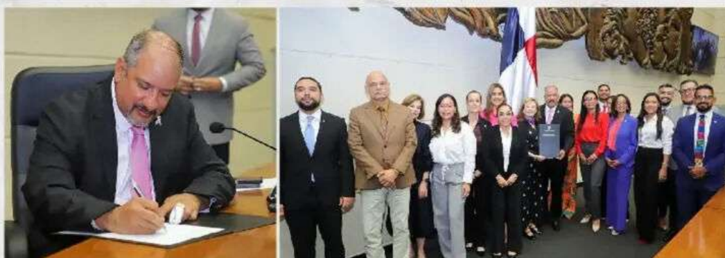
Aprobación en tercer debate