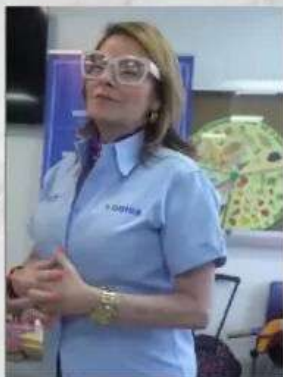
Centro de salud de Kuna Nega