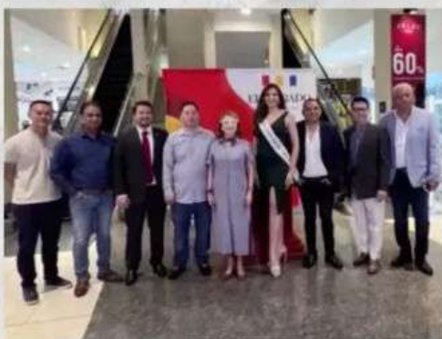
Inauguración de la nueva parada de buses