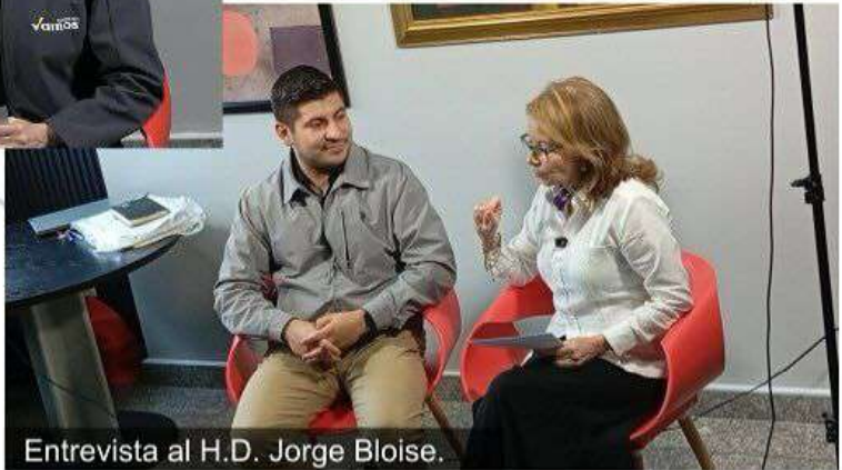
Entrevista al H.D. Jorge Bloise.