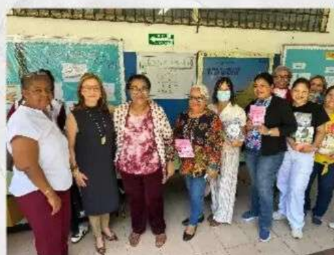
Colegio La Santa Familia