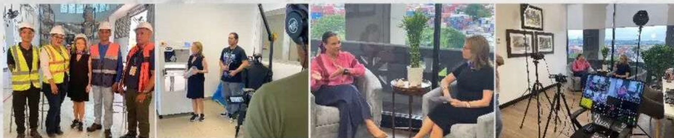
Instituto Técnico Superior Especializado - ITSE