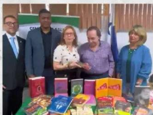
Centro de Salud de Santa Ana