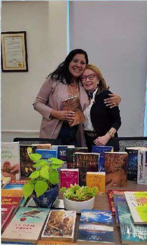
Junta Comunal de Ancón