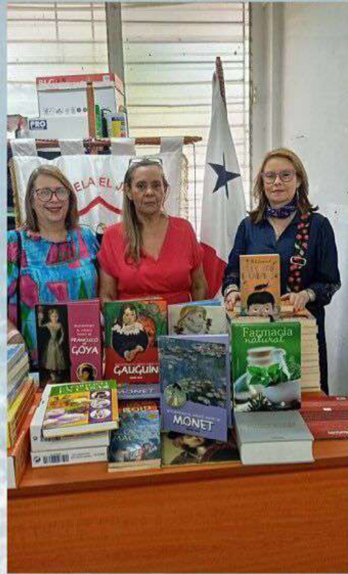
Escuela El Japón